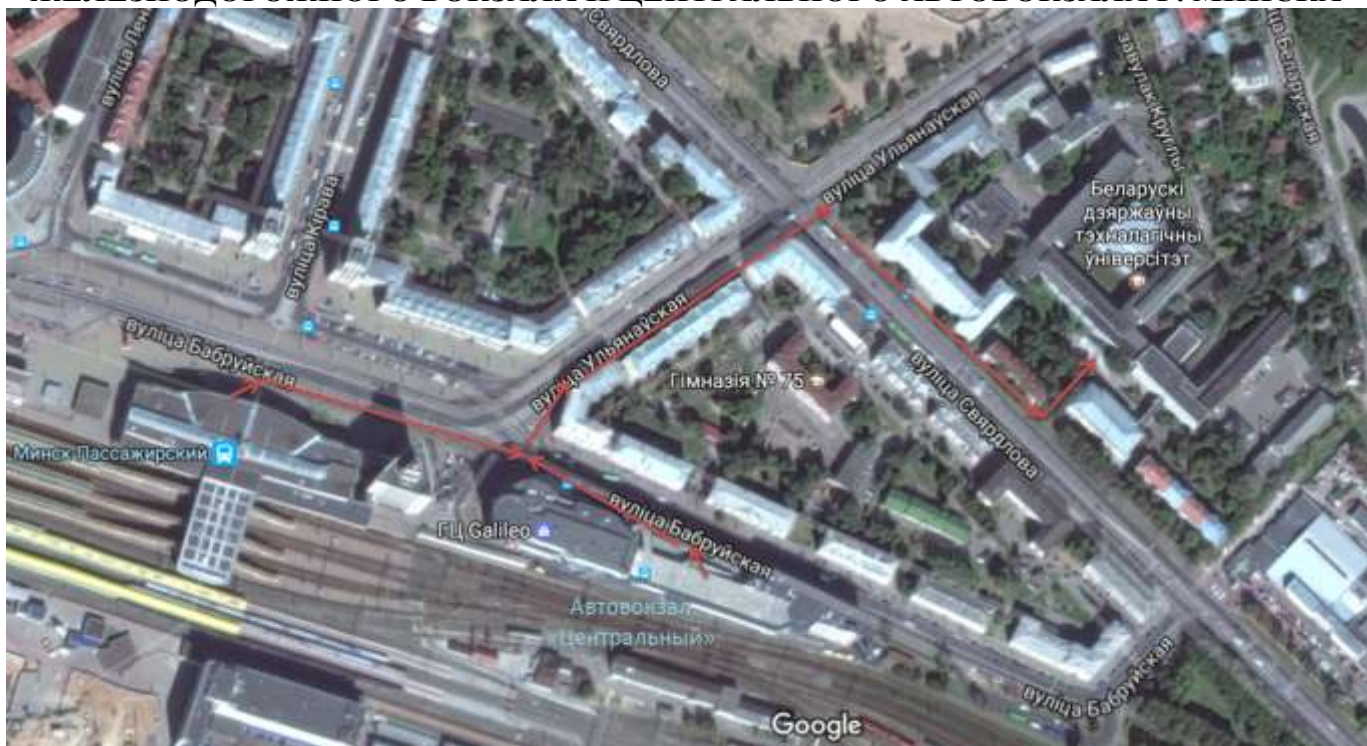
СХЕМА ПРОЕЗДА К МЕСТУ ПРОВЕДЕНИЯ КОНФЕРЕНЦИИ ОТ ЖЕЛЕЗНОДОРОЖНОГО ВОКЗАЛА И ЦЕНТРАЛЬНОГО АВТОВОКЗАЛА Г. МИНСКА