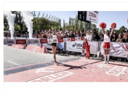
Белорусская бегунья ...